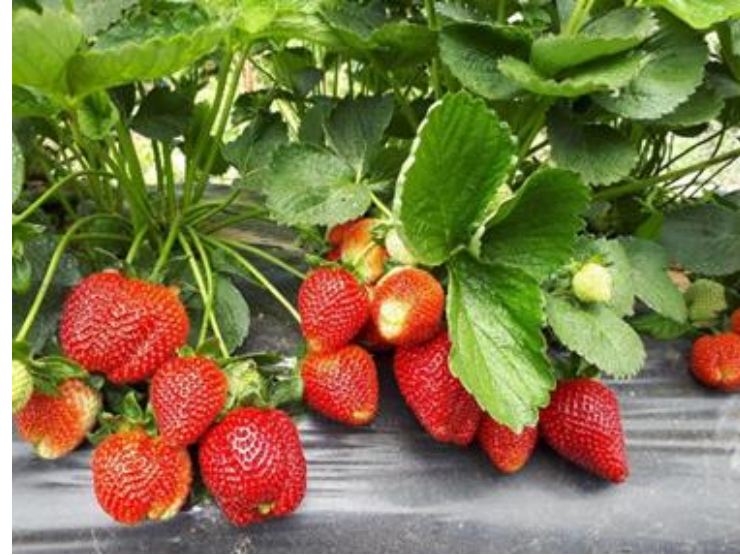
Sultanhisar Çileği (2020– Mahreç türünde)