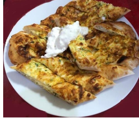
Bozdoğan Pidesi (2022 – Mahreç İşareti)