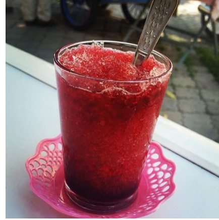
Nazilli Kar Helvası (2018 – Mahreç türünde)