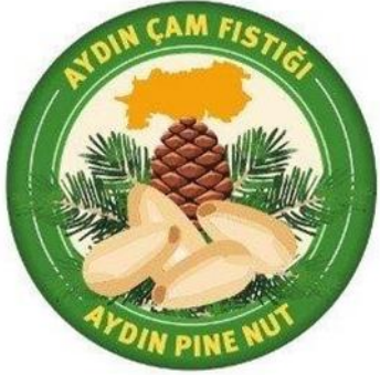
Aydın Çam Fıstığı (2021 – Menşe türünde)

AYDIN İL MÜDÜRLÜĞÜ Aydın İli olarak mevcut durumda 32 adet coğrafi işaretli ürünümüz var. (8'si Menşe adı - 24'ü Mahreç ) 4 adet ürünümüz AB de Tescillidir. 1 Adet Geleneksel Ürünümüz var.