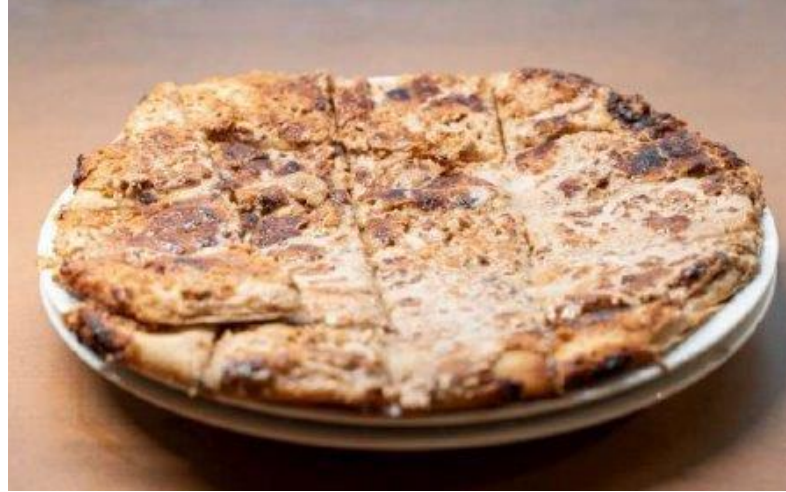
Söke Tahinli Pidesi (2024 – Mahreç türünde)