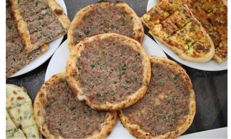
Yenipazar Pidesi (2024 – Mahreç türünde)