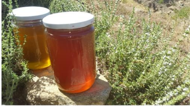
Dikmen Çiçek Balı/ Dikmen Kekik Balı (2020 – Menşe türünde)