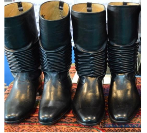
Söke Körüklü Çizmesi (2018 – Mahreç türünde)