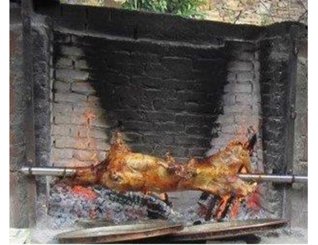
Olukbaşı Oğlak Çevirme (2023 – Mahreç türünde)