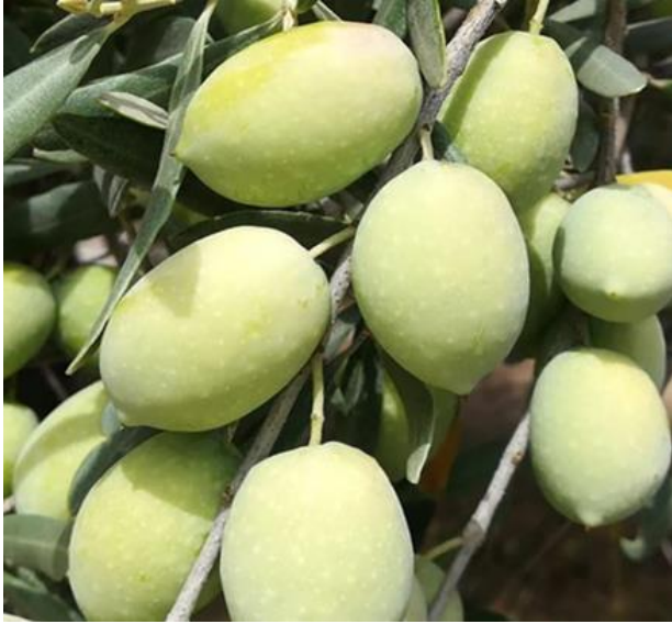
Aydın Memecik Zeytini (2021 – Menşe türünde)

Aydın İli olarak mevcut durumda 32 adet coğrafi işaretli ürünümüz var. (8'si Menşe adı - 24'ü Mahreç ) 4 adet ürünümüz AB de Tescillidir. 1 Adet Geleneksel Ürünümüz var.