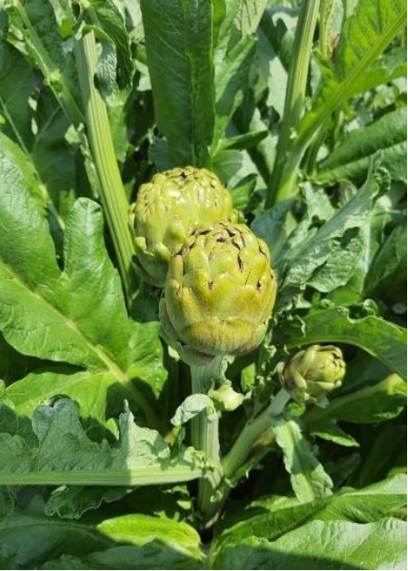
Aydın Enginarı (2025 – Mahreç İşareti)