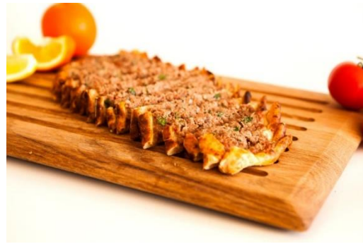
Nazilli Pidesi (2020 – Mahreç türünde)