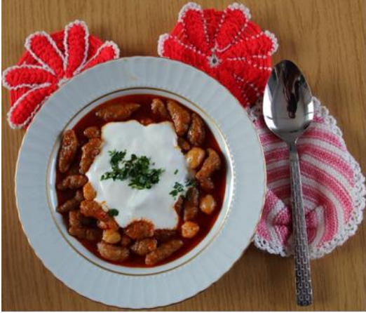
Aydın Yuvarlaması (2022 – Mahreç türünde)

Aydın İli olarak mevcut durumda 31 adet coğrafi işaretli ürünümüz var. (8'si Menşe adı - 24'ü Mahreç ) 4 adet ürünümüz AB de Tescillidir. 1.Adet Geleneksel Ürünümüz var.