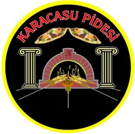
Karacasu Pidesi (2020 – Mahreç türünde)

Aydın İli olarak mevcut durumda 32 adet coğrafi işaretli ürünümüz var. (8'si Menşe adı - 24'ü Mahreç) 4 adet ürünümüz AB de Tescillidir. 1.Adet Geleneksel Ürünümüz var.