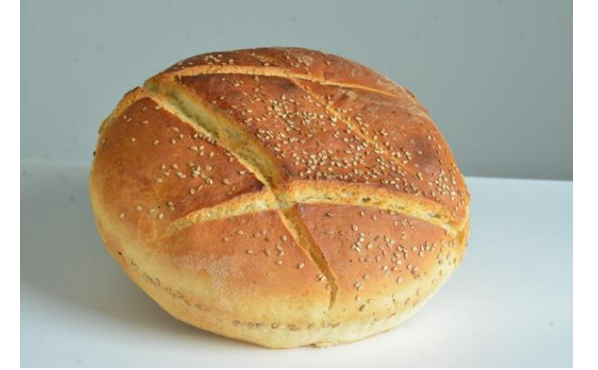
Söke Tatlı Maya Ekmegi (2021 – Mahreç türünde)