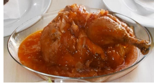
Germencik Ekşili Tavuk (2020 – Mahreç türünde)