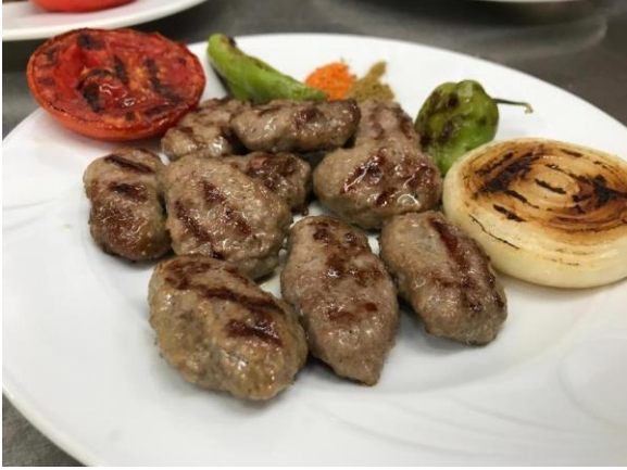
Çine Köftesi (2018 (2018– Mahreç türünde)

Aydın İli olarak mevcut durumda 32 adet coğrafi işaretli ürünümüz var. (8'si Menşe adı - 24'ü Mahreç ) 4 adet ürünümüz AB de Tescillidir. 1.Adet Geleneksel Ürünümüz var.