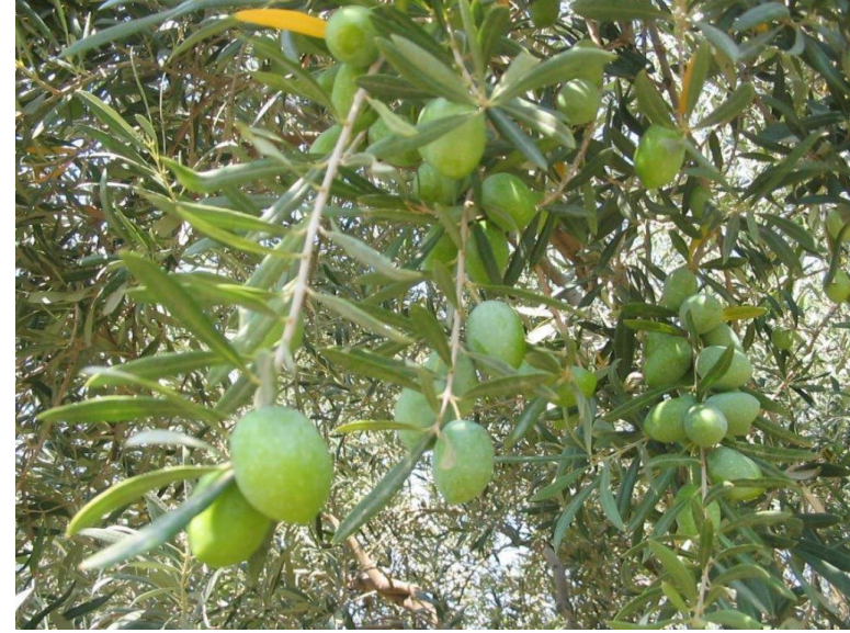
Aydın Yamalak sarısı (2021 – Menşe türünde)