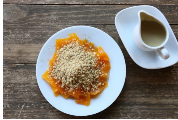
Aydın Kabak Tatlısı (2021 – Mahreç türünde)