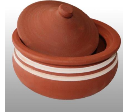
Karacasu Çömleği (2020 – Mahreç türünde)