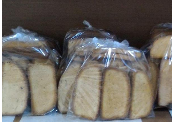
Söke Peksimeti (2024 – Mahreç İşareti)