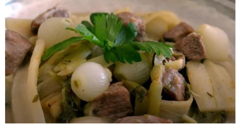
Söke Şevketi Bostan Yemeği (2022 – Geleneksel Ürün)

Aydın İli olarak mevcut durumda 32 adet coğrafi işaretli ürünümüz var. (8'si Menşe adı - 24'ü Mahreç ) 4 adet ürünümüz AB de Tescillidir. 1.Adet Geleneksel Ürünümüz var.