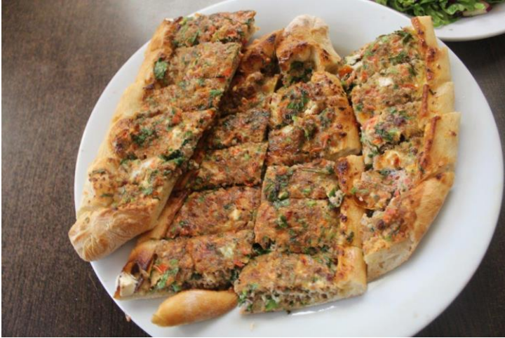
Söke Pidesi (2022 – Mahreç türünde)