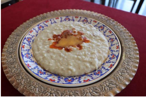
Dedebağ Keşkeği/Karacasu keşkeği (2021 – Mahreç türünde)