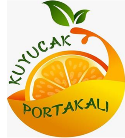
Kuyucak Portakalı (2023 – Menşe türünde)