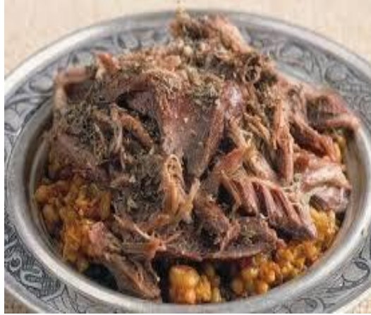
Dalama Tandırı (2017 – Mahreç türünde)