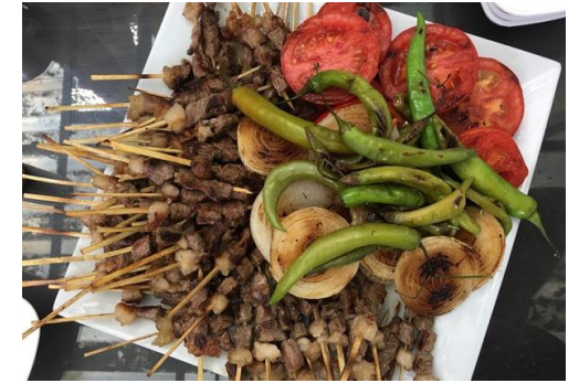
Ortaklar Çöp Şiş (2020 – Mahreç türünde)