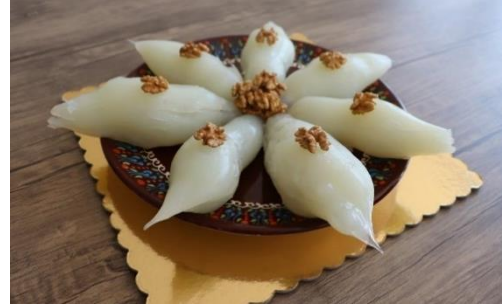
Bozdoğan Cevizli sucuğu (2020 – Mahreç türünde)