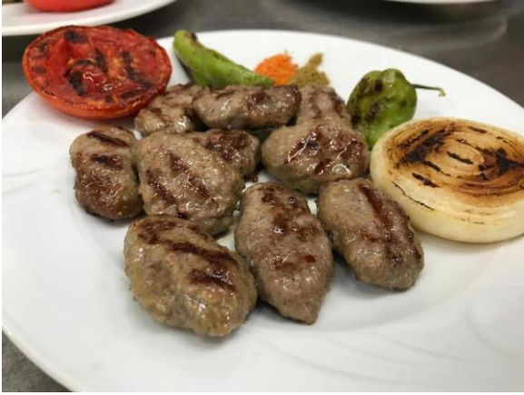
Çine Köftesi (2018 (2018– Mahreç türünde)