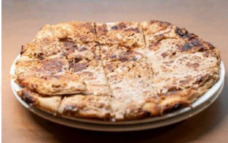
Söke Tahinli Pidesi (2024 – Mahreç türünde)