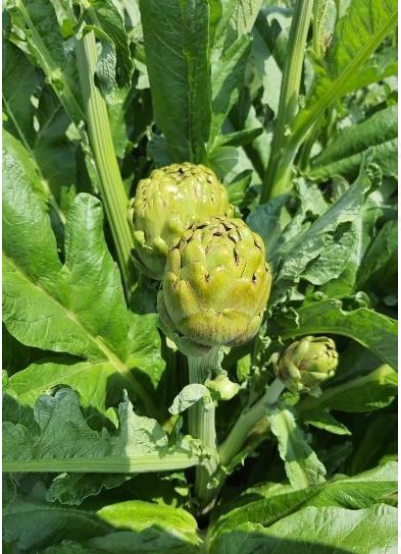
Aydın Enginarı (2025 – Mahreç İşareti)