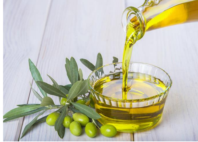
Aydın Memecik Zeytinyağı (2020 – Menşe türünde)