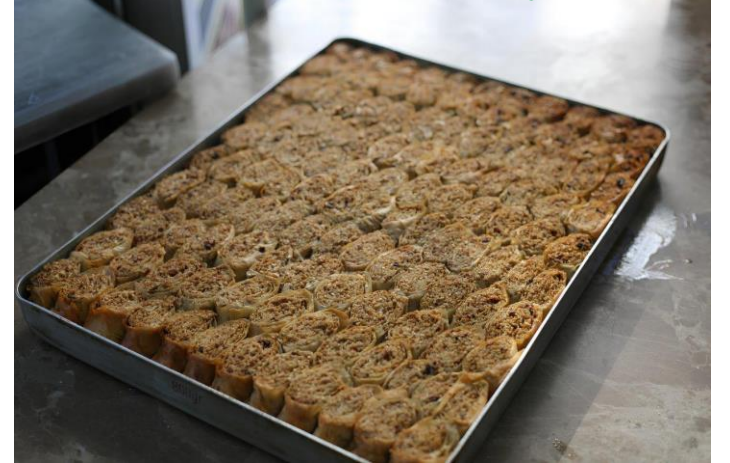
Söke Kulak tatlısı (2025 – Mahreç İşareti)