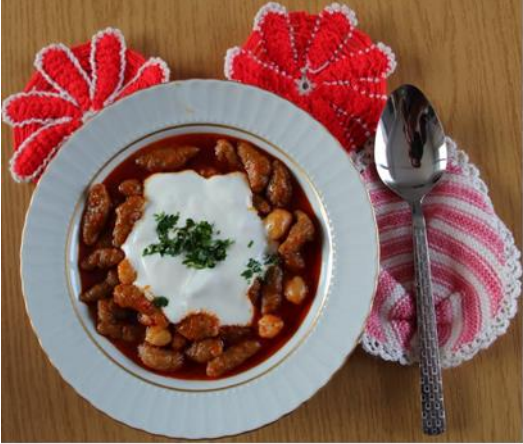
Aydın Yuvarlaması (2022 – Mahreç türünde)