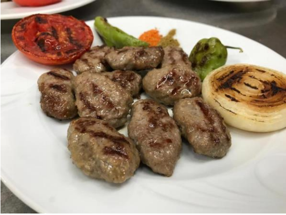
Çine Köftesi (2018 (2018– Mahreç türünde)