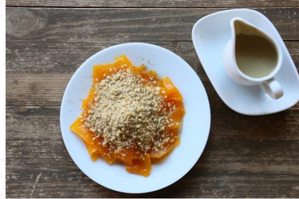
Aydın Kabak Tatlısı (2021 – Mahreç türünde)