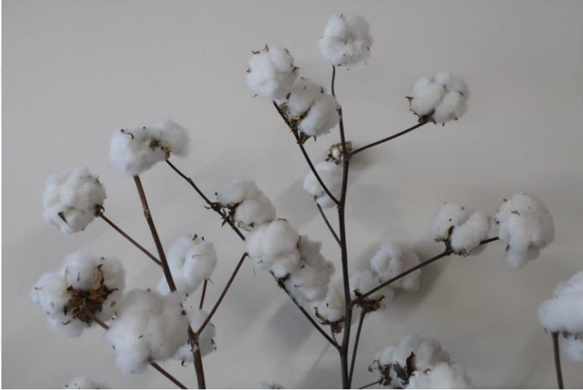
Söke Pamuđu (2023– Mahreç türünde)

Aydın İli olarak mevcut durumda 35 adet cođrafi iřaretli ürünümüz var. (8'i Menş e adı - 27'si Mahreç ) 6 adet ürünümüz AB de Tescillidir. 1.Adet Geleneksel Ürünümüz var.