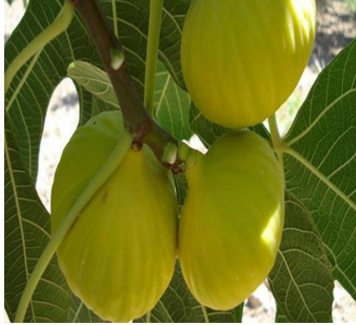
Aydın İnciri (2007 - Menşe türünde) AB'de tescillidir. 2015