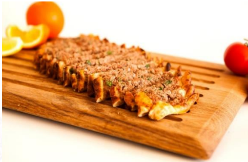
Nazilli Pidesi (2020 – Mahreç türünde)