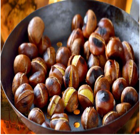
AYDIN KESTANESİ (2010 –Menşe türünde) AB'de tescillidir. 2020

Aydın İli olarak mevcut durumda 35 adet coğrafi işaretli ürünümüz var. (8'ii Menşe adı - 27'si Mahreç ) 6 adet ürünümüz AB de Tescillidir. 1 Adet Geleneksel Ürünümüz var.