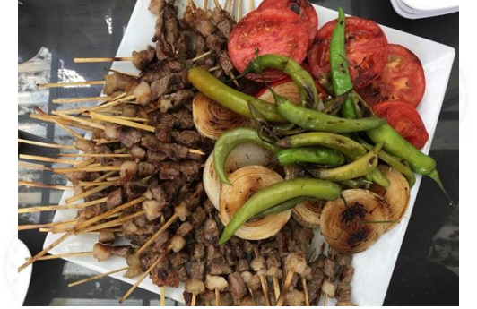
Ortaklar Çöp Şiş (2020 – Mahreç türünde)