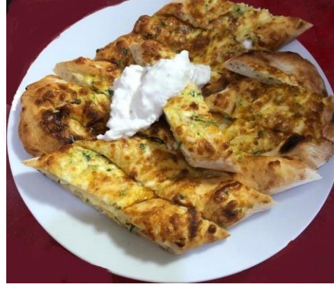
Bozdoğan Pidesi (2022 – Mahreç İşareti)