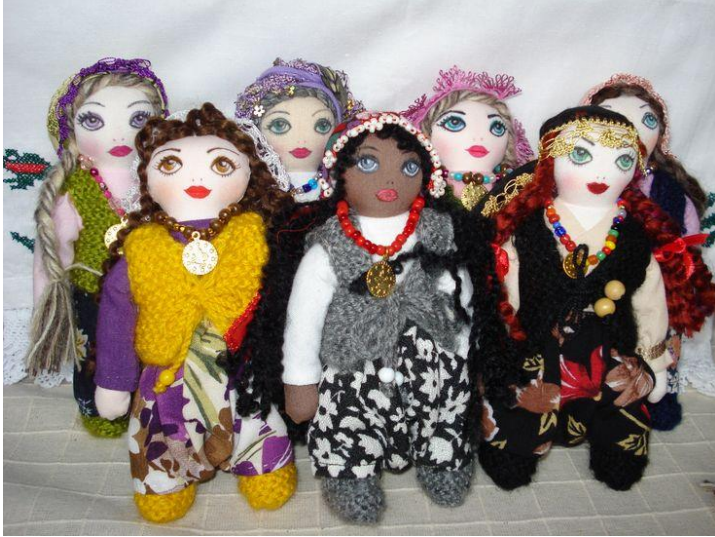
Güllübahçe Bez Bebekleri (2025 – Mahreç İşareti)