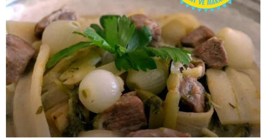
Söke Şevketi Bostan Yemeği (2022 – Geleneksel Ürün)